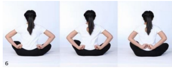
ภาพที่ 9 ท่าชูหัตถ์วาทหลัง 23

ดัดมือประสานกันเหนือศีรษะให้หางมือขึ้น ผ่อนลมหายใจออกพร้อม ๆ กันค่อย ๆ วาดมือทั้ง 2 ข้างออกจากกันไปทางด้านหลังค่อย ๆ งอแขนกำมือมาวางที่บั้นเอวทั้ง 2 ข้าง