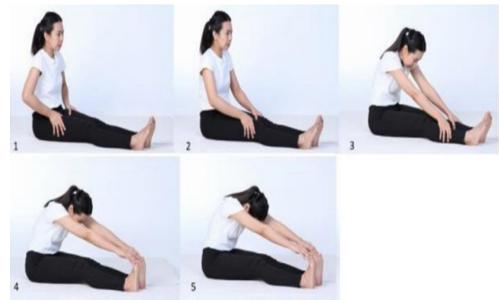
ภาพที่ 10 ทำนั่งนวดขา 23

ประโยชน์ : แก้กล้ามเนื้อและแก้เข่าขัด (คำว่า “กล้ามเนื้อ” คือ ความเสื่อม “กล้ามเนื้อขยับ” คือ โรคเรื้อรัง มีความเสื่อมของอวัยวะ)