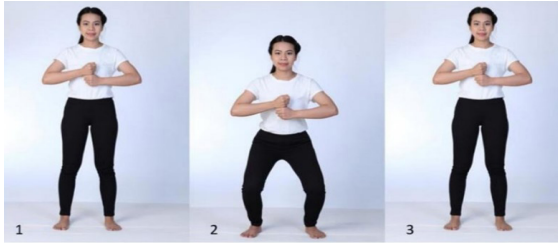
ภาพที่ 12 ท่าดำรงกายอายุยืน 23

เริ่มจากยืนตรง เท้า 2 ข้างแยกออก ความกว้างเท่าระดับไหล่ พร้อมกับกำมือทั้ง 2 ข้าง โดยให้มือข้างซ้ายอยู่บนมือข้างขวา อยู่ระดับอก บริเวณลิ้นปี่ โดยห่างจากอก สูดลมหายใจเข้าให้ลึกที่สุด จากนั้นย่อตัวลงช้า ๆ พร้อม ๆ กับการแขม่วท้องและขมิบก้น จากนั้นจึงค่อย ๆ ผ่อนลมหายใจออก พร้อมกับค่อย ๆ ยืดตัวให้กลับมามีอยู่ในท่าเตรียม ทำซ้ำ 5 - 10 ครั้ง