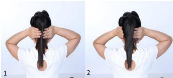
ภาพที่ 7 ท่าตบท้ายทอย 23

ใช้ฝ่ามือทั้งสองข้างปิดหูไว้ โดยให้ปลายนิ้วทั้งสองข้างวางอยู่บริเวณท้ายทอย และปลายนิ้วกลางจรดกัน กระดกนิ้วชี้ขึ้นให้มากที่สุด แล้วตบที่ท้ายทอยพร้อมกันโดยไม่ยกฝ่ามือ (ทำซ้ำ 10 ครั้ง) ซึ่งทำนี้จะช่วยในเรื่องของการส่งเลือดไปเลี้ยงที่บริเวณใบหน้า รวมทั้งช่วยบำรุงสายตา และส่งเลือดไปเลี้ยงสมอง *** สำหรับทำนี้ต้องไม่ยกฝ่ามือออกจากหู เพราะทำให้การตบแรงเกินควร จะให้ผลเสียได้