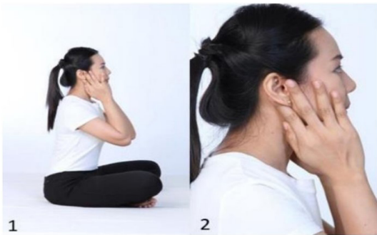
ภาพที่ 6 ท่าภูและภูหลังหู 23

ใช้นิ้วชี้และนิ้วกลางทั้งสองข้างคืบหูลอย่างหลวม ๆ วางมือให้ฝ่ามือแนบสนิทกับแก้ม ภูขึ้นลงแรง ๆ นับเป็น 1 ครั้ง (ทำซ้ำ 20 ครั้ง)