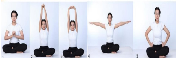
ภาพที่ 8 ท่าชูหัตถ์วาทหลัง 23

ประโยชน์: แก้ปวดท้องและข้อเท้า และแก้ลมปวดศีรษะ