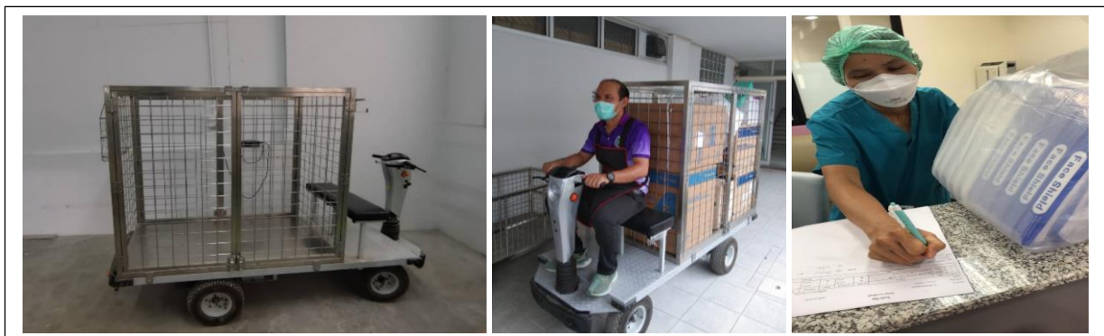
รูปภาพที่ 2. การใช้รถไฟฟ้าในการส่งวัสดุและผลิตภัณฑ์สนับสนุนทางการแพทย์