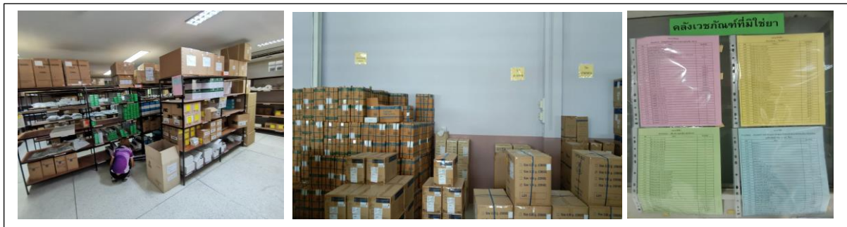
รูปภาพที่ 1. การปรับปรุงพื้นที่จัดเก็บวัสดุ และการคัดแยกและติดป้ายวัสดุ ผลิตภัณฑ์

3) การใช้รถไฟฟ้าในการจัดส่งวัสดุและผลิตภัณฑ์ เป็นการลดความสูญเปล่าจากการเคลื่อนไหวที่ไม่จำเป็น ซึ่งสามารถให้หน่วยบริการมารับวัสดุและผลิตภัณฑ์หลังส่งใบเบิกได้ภายใน 48 ชั่วโมง