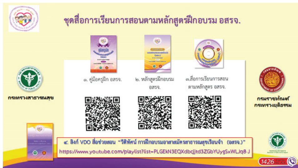
รูปภาพที่ 6 เอกสาร 1 หน้า รวมชุดสื่อการเรียนรู้การสอนตามหลักสูตรการฝึกอบรม อสรจ. ในโครงการราชทัณฑ์ปันสุข ทำความ ดี เพื่อชาติ ศาสน์ กษัตริย์

3.4 การส่งมอบ คณะผู้จัดทำและหน่วยงานที่เกี่ยวข้อง ได้ร่วมนำมอบชุดสื่อต้นแบบการฝึกอบรมตามหลักสูตร การฝึกอบรม อสรจ. ในโครงการ เพื่อทรงโปรดเกล้า พระราชทานแก่เรือนจำนำร่อง อีกทั้ง ได้จัดส่งชุดสื่อต้นแบบ การฝึกอบรมตามหลักสูตรการฝึกอบรม อสรจ. ในโครงการ ไปยังกรมราชทัณฑ์ กระทรวงยุติธรรม กรมวิชาการในสังกัด กระทรวงสาธารณสุข และภาคีเครือข่ายที่เกี่ยวข้อง และได้ร่วม ชี้แจงแนวทางการฝึกอบรม ร่วมฝึกอบรม ร่วมติดตาม ประเมินผลการฝึกอบรมตามหลักสูตรการฝึกอบรม อสรจ. ในโครงการ เพื่อสนับสนุนให้ภาคส่วนต่าง ๆ ที่เกี่ยวข้อง อาทิ เรือนจำในสังกัดกรมราชทัณฑ์ กรมวิชาการในสังกัด กระทรวงสาธารณสุข และหน่วยงานภาคีเครือข่าย สามารถ พัฒนาครูฝึก อสรจ. และฝึกอบรม อสรจ. สนับสนุนการจัดระบบ บริการสาธารณสุขสำหรับผู้ต้องขังในเรือนจำ ให้บรรลุผล ตามเป้าหมายที่กำหนดไว้