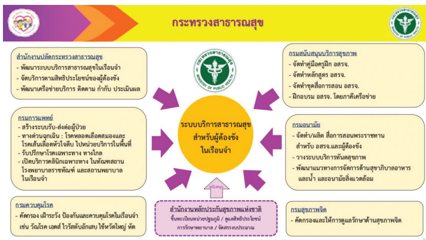
รูปภาพที่ 2 การแบ่งบทบาทหน้าที่ความรับผิดชอบของกรมวิชาการในสังกัดกระทรวงสาธารณสุข