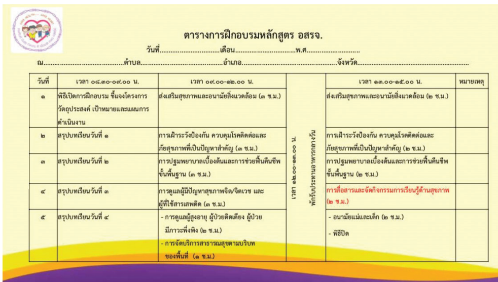
รูปภาพที่ 5 ตารางการฝึกอบรมวิทยากรครูฝึก อสรจ. และ อสรจ. เพื่อการทดลองใช้หลักสูตรฝึกอบรม อสรจ.

จากผลการประเมินการทดลองใช้ คณะผู้จัดทำและหน่วยงานที่เกี่ยวข้อง ได้ร่วมประชุมพิจารณาผลการประเมิน และมอบให้คณะผู้จัดทำนำไปผลิตเป็นหลักสูตรการฝึกอบรม อสรจ. ต้นแบบ ประกอบด้วย 1) คู่มือครูฝึก อสรจ. 2) หลักสูตรฝึกอบรม อสรจ. 3) สื่อการเรียนการสอน อสรจ. และ 4) VDO สื่อช่วยสอนการฝึกอบรม อสรจ. ในรูปแบบรูปเล่ม แผ่น DVD ไฟล์เอกสาร ไฟล์สื่อวีดิทัศน์ และ Link เชื่อมไฟล์ ข้อมูล และเพื่อความสะดวกในการเผยแพร่หลักสูตรการฝึกอบรม อสรจ. ต้นแบบ คณะผู้จัดทำ ได้ผลิตเป็นเอกสาร 1 หน้า รวมชุดสื่อการเรียนการสอนตามหลักสูตรการฝึกอบรม อสรจ. ในโครงการ (รูปภาพที่ 6)