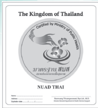
แผนภาพที่ 1