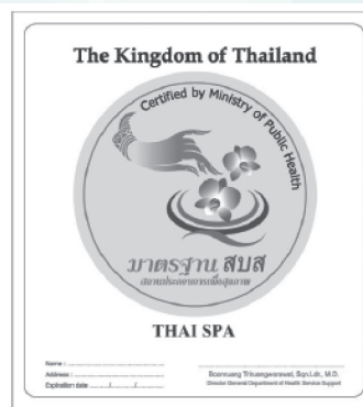
แผนภาพที่ 2

การยื่นขอรับรองมาตรฐาน สถานประกอบการที่มีความประสงค์ขอรับรองมาตรฐานให้ยื่นใบสมัครขอรับการรับรองผ่านหน่วยงานภาครัฐของไทยในต่างประเทศ หรือสมาคมสปาไทยในต่างประเทศ สมาคมนวดไทยในต่างประเทศ ที่กระทรวงสาธารณสุขหรือกระทรวงต่างประเทศเห็นชอบหรือให้การยอมรับ หลังจากได้รับเอกสารหน่วยงานดังกล่าวจะมีหน้าที่พิจารณาและรับรองเอกสารการขอรับรอง โดยผ่านสถานเอกอัครราชทูต หรือสถานกงสุลใหญ่ในประเทศนั้นๆ กรณีที่เอกสารตรวจสอบไม่ผ่าน เอกสารจะส่งกลับไปยังสถานประกอบการ สำหรับเอกสารที่ตรวจสอบผ่านจะส่งต่อมายังกองสถานประกอบการเพื่อสุขภาพ กรมสนับสนุนบริการสุขภาพ กระทรวงสาธารณสุข โดยกองสถานประกอบการเพื่อสุขภาพ เป็นผู้ดำเนินการในกระบวนการตรวจรับรองมาตรฐานต่อไป